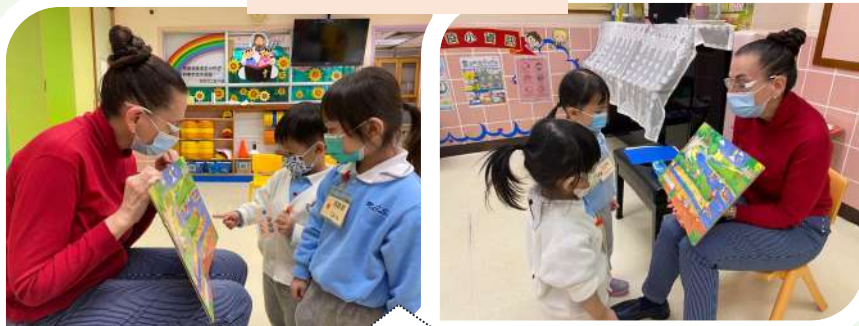
Miss Susan: Children, can you find the blue colour? Children : Yes!