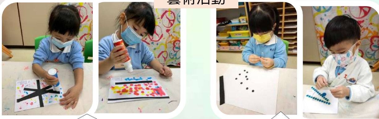
「我哋點緊唔同顏色嘅水彩，好靚呀！」