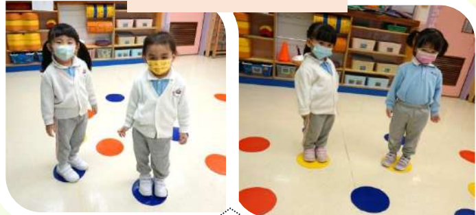
「老師話搵藍/黃色喇，快啲去啦！」