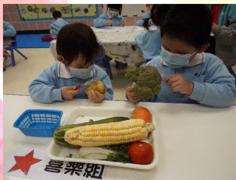
「嘩！西蘭花有好多花㗎！」