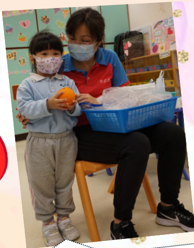
「我哋帶左唔同嘅水果同小朋友分享呀！」