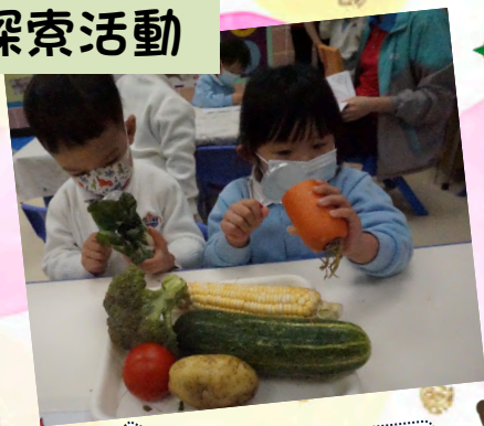
「紅蘿蔔裏面好得意呀！」