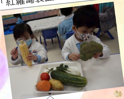
「我好鍾意食粟米架！」